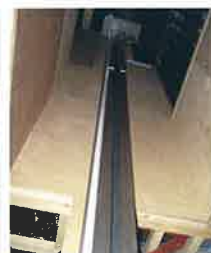
狭小スペース活用